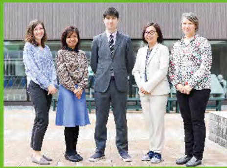
E-Talk Room / 5名のネイティブ教員 海外大学進学セミナー / 4技能セミナー

E-Talk Roomには、5名のネイティブ教員が常駐。生徒はいつでも英語でコミュニケーションがとれます。スピーチやエッセイ指導のほか、行事・放課後の勉強会なども通して、自然な英語を身につけます。海外大学への進学を目指した海外大学進学セミナーを2020年度より開講しています。