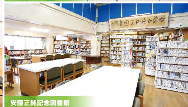
安藤正純記念図書館