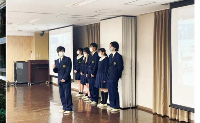
SDGs成果発表 中間報告会