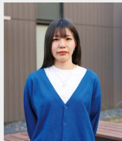
中央大学 理工学部生命科学科 A.Y 2021年度卒業

生物の授業でタンパク質や遺伝の仕組みなどを学び、自分がただの物質の集まりであることや体内で起こる反応がとても不思議でおもしろく、もっと深く学びたいと生命科学系の進路を志望しました。苦労したのは 数学と向き合うこと です。数学が苦手にもかかわらず理系に進んだためがむしゃらに勉強したものの、成績が伸び悩んだのです。そこで高3の夏から、定義から学び直して土台を作るとともに、1日の勉強の7割を数学に費やすことで受験前には自信が持てるようになりました。化学の授業やセミナーでは、先生が過去の頻出問題集を作って熱心に教えてくださったので、抵抗なく演習問題に取り組むことができました。将来の目標は、 新しいものを自ら作り出すこと です。そのためにも大学では、生物学はもちろん、それ以外のさまざまな分野も学び、関心を持ったものについて自分が納得できるまで研究を深めていきたいです。