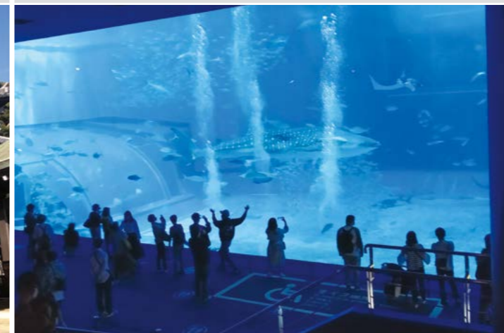
国際研修旅行(沖縄)(高2)