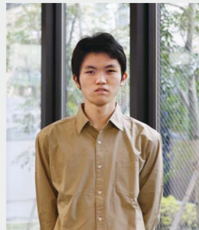
東京工業大学 理学院 Y.O 2021年度卒業

私は理系科目が好きで、教育に興味があります。そして人に何かを教えるためには、 その分野のスペシャリストになっていなければならない と考え、研究環境が充実している東京工業大学を第一志望に選びました。この進路を考え始めたのは、高2の12月頃です。 受験に向けて頑張っている先輩の姿から刺激を受けた のです。努力したのは第一志望を目指し続ける意思を持続させることです。授業が終わった後にそのまま受講できる進学セミナー、朝の時間を使った学習指導は、私にとってメリットが大きく、また英語の授業でのリスニングや、数学の授業でいろいろな大学の過去問題を解かせてくださったことも受験の役に立ちました。大学では現代数学の基礎を学んだうえで、代数系・幾何系・解析系のいずれかを専門分野として学修するとともに、教職課程を履修し、将来は数学の教員になりたいと考えています。