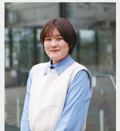
学習院大学 経済学部経済学科 A.F 2021年度卒業

学習院大学経済学部を選んだ理由は、好きな数学を活かせる学びをしたかったからです。受験科目として数学を選択できたのも決め手になりました。また学習院大学の雰囲気も私にとっては魅力でした。4年間の学び舎と考えた時、そこを魅力に思えるかどうかは重要なポイントではないかと思ったのです。合格を目指して大切にしてきたことは、 きちんと学校に通い、しっかり授業を受けること です。現代文の授業や進学セミナーの英語が大変役に立ちました。また数学に関しても受験に役立つテキストを貸していただくなど、先生方にはさまざまなサポートをしていただきました。将来の具体的な目標はまだ明確ではありませんが、大学では、 経済学を生かした職業に就きたいので、そのための資格取得に向けた勉強 に取り組むつもりです。卒業後は女性として輝ける仕事に就き、ずっと働き続けたいと思っています。